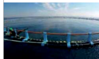
▲ Viveros Flotantes (peces)