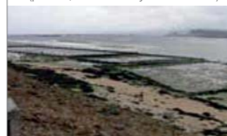
▲ Parques de cultivo (moluscos)