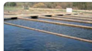
▲ Tanques de agua dulce (peces)