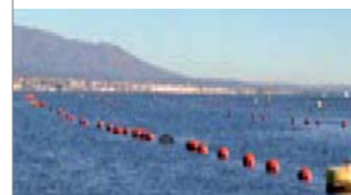
▲ Long-lines (moluscos)