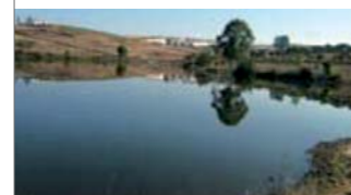
▲ Charcas y estanques (peces)