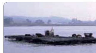
▲ Bateas (moluscos)