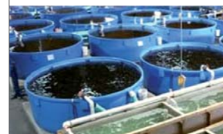
▲ Tanques de agua salada (peces)