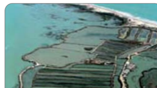
▲ Esteros (peces, moluscos y crustáceos)